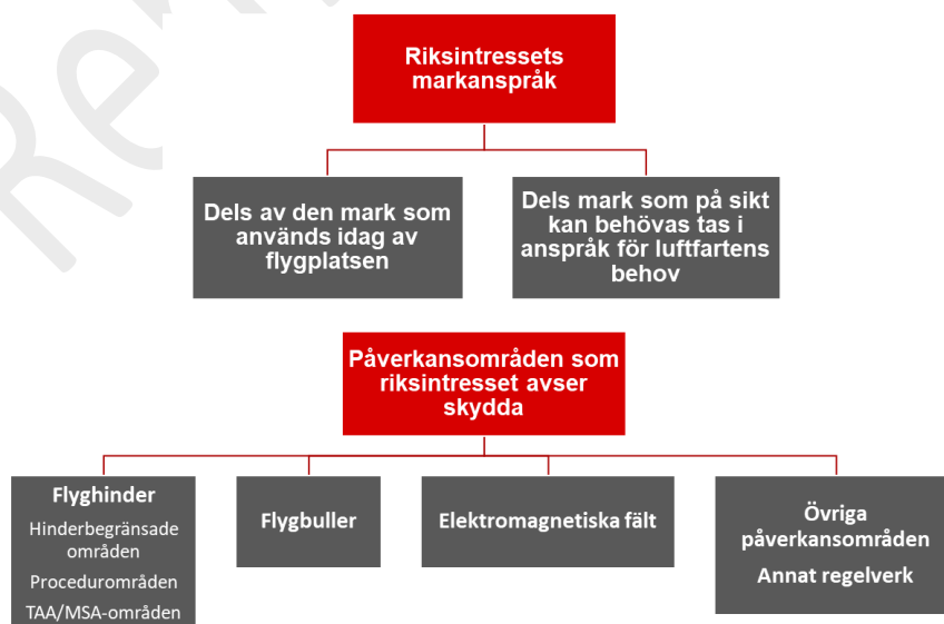
Figur 1 Riksintresse Flygplats

Underlagsmaterialet för luftfartens riksintressen består dels av flygplatsens markanspråk och dels av påverkansområden, vilka omfattar buller- och hinderytor (exempelvis MSA- eller TAA- ytor), elektromagnetiska fält och övriga påverkansområden kopplat främst till luftfartens regelverk (från Transportstyrelsen, ICAO, EASA), se figur 3 nedan.